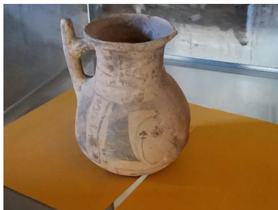
Museo Paranturí. Jarra con pitón