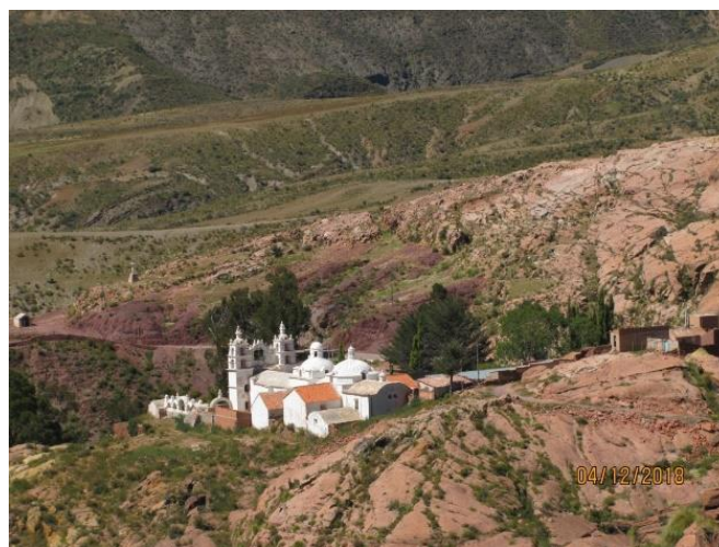
Manquiri: Santuario de Manquiri